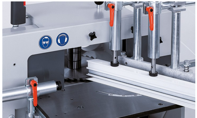
Fraiseuse en bout AF 222/02