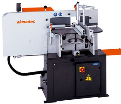
Fraiseuse en bout AF 222/02